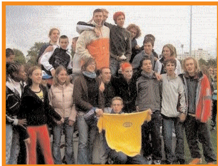
Victoire de la Ligue Nord/Pas-de-Calais d'athlétisme

Le rendez-vous est donné pour l'année prochaine ou nous espérons retrouver encore plus d'équipes ligue.