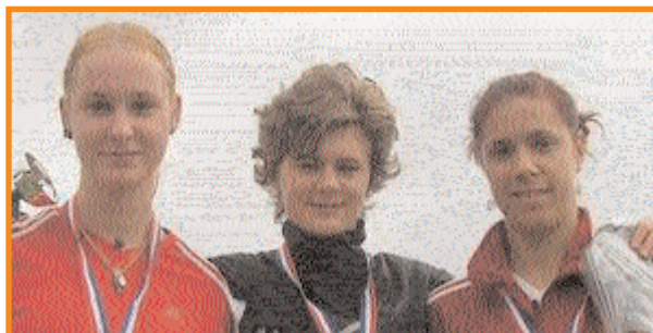
Le podium juniors filles

Au niveau des clubs, la plus forte représentation, avec 8 jeunes, vient de la M.J. Trouville. Suivent ensuite l'E.A Cherbourg avec 6 marcheurs, à égalité avec l'U.S. Bazas, l'ASPTT Lille M, et le C.A. Montreuil.