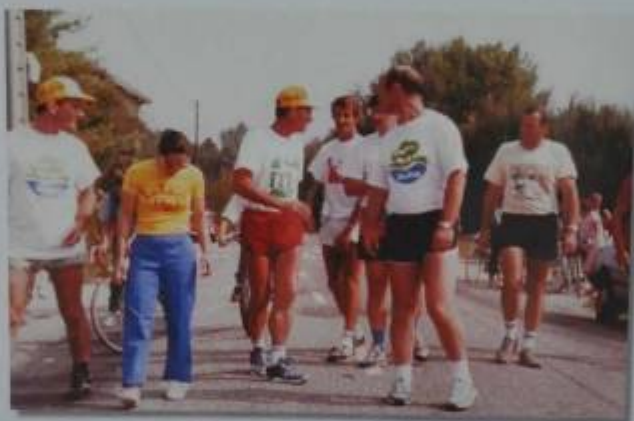
Pour améliorer le record, nous quittons Dampierre le 4 août 1989