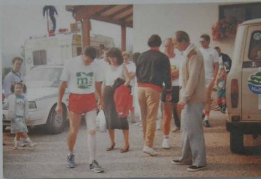
Le 5 août 1989 avant le départ pour Madine