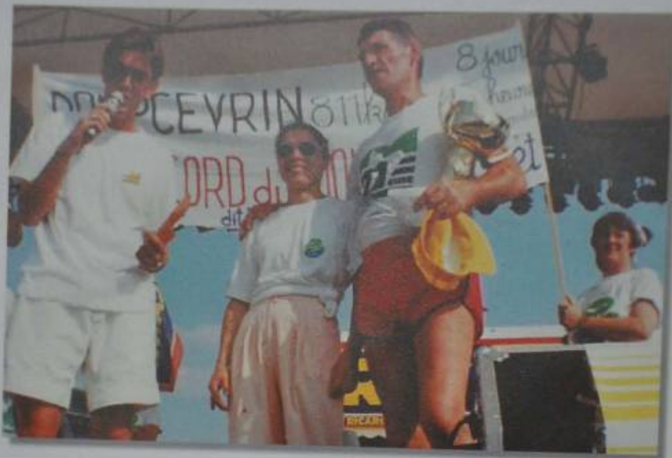
Sur le podium avec l'animateur