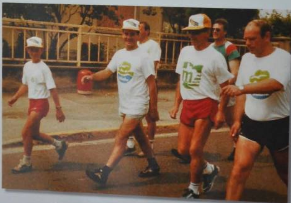
Dans Chauvencourt le 4 août 1989 en route pour améliorer le record