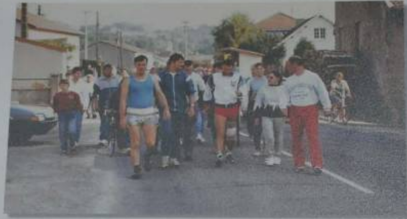
Nous quittons Dompcevin le 2 août après 550 km avec un genou en vrac.