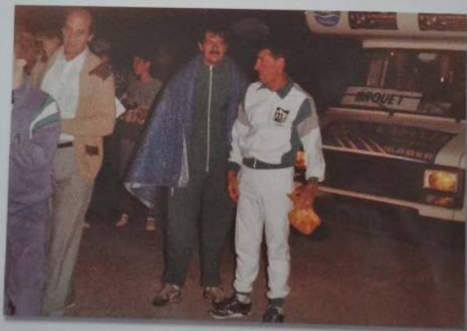
Arrêt pour des soins à la salle des fêtes de Dompcevrin