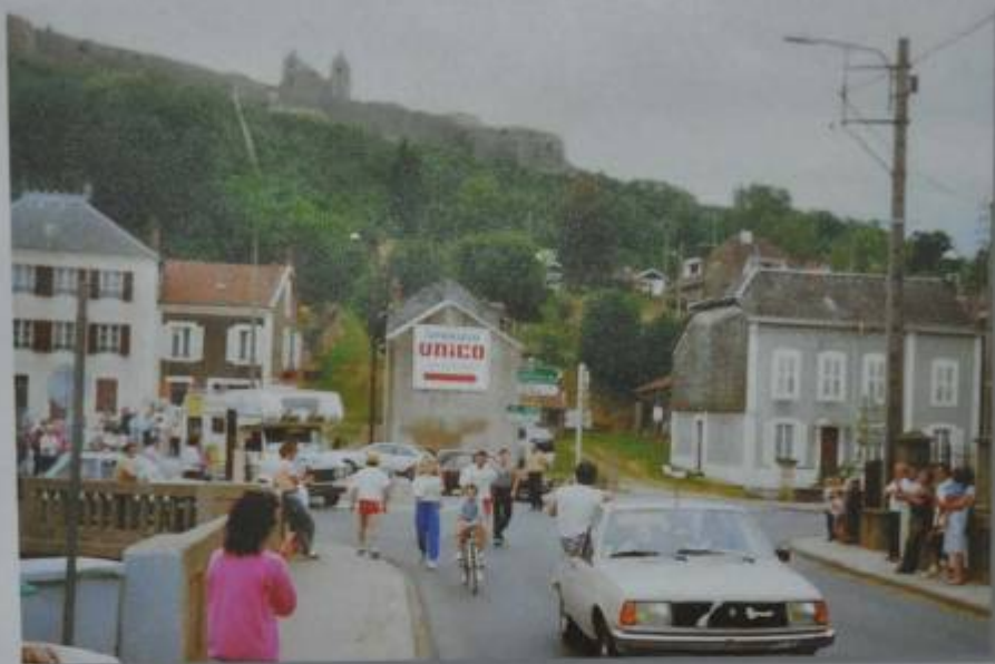
Passage à Montmédy le 30 juillet 1989 à 15 h20