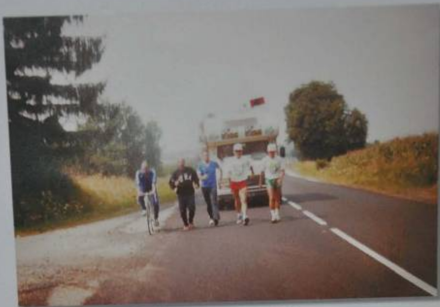
Le 28 juillet 1989 avec des amis du 8 e R.G. vers Vadonville