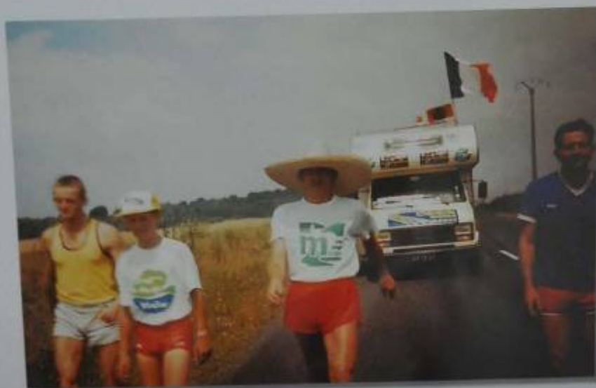
Entre Commercy et Void, le 2 août 1989 avec des militaires du 8 e R.G.