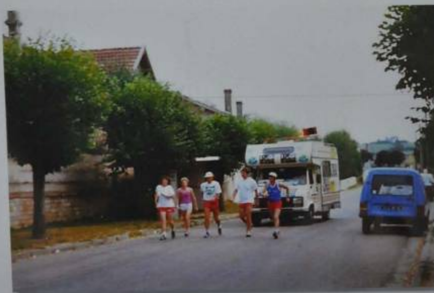
même jour à la sortie de la ville