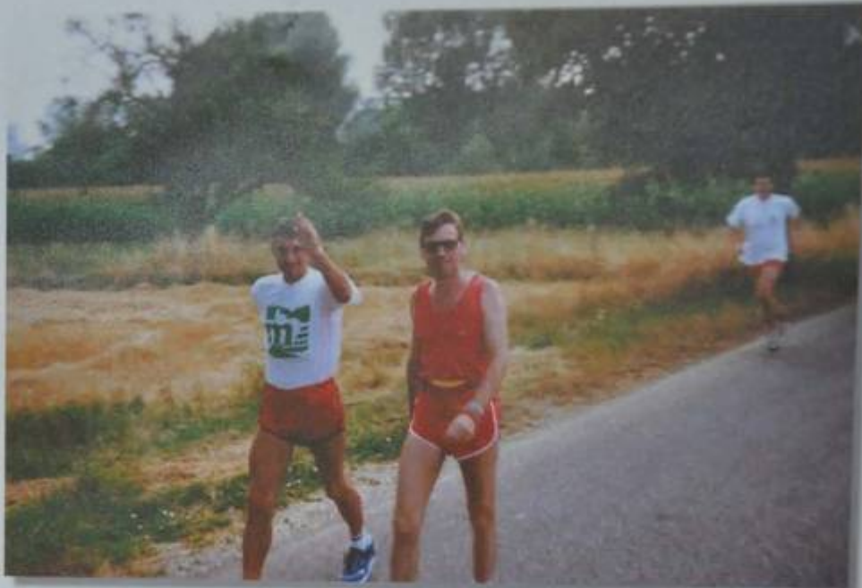
Quelque part sur la route !