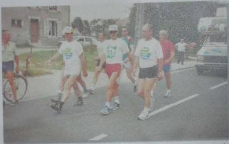
Dans Chauvencourt, en route pour améliorer le record