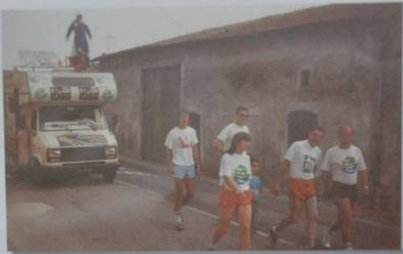
le 5 août 1989