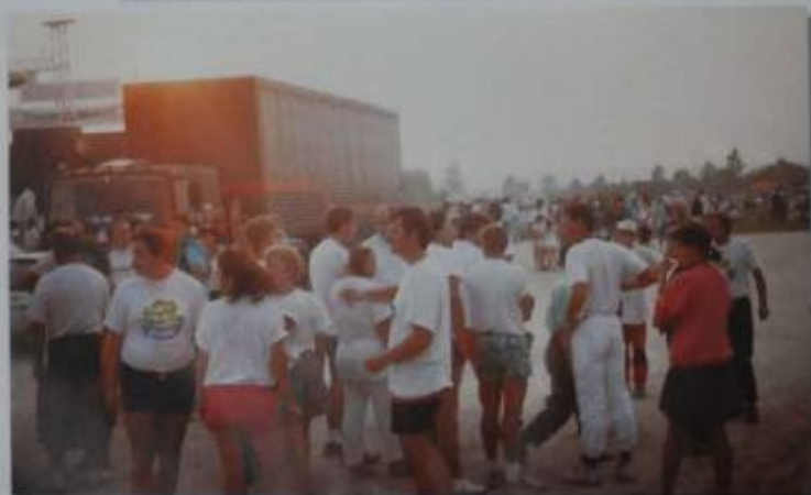
Relax pour tous à Madine en attendant le feu d'artifice