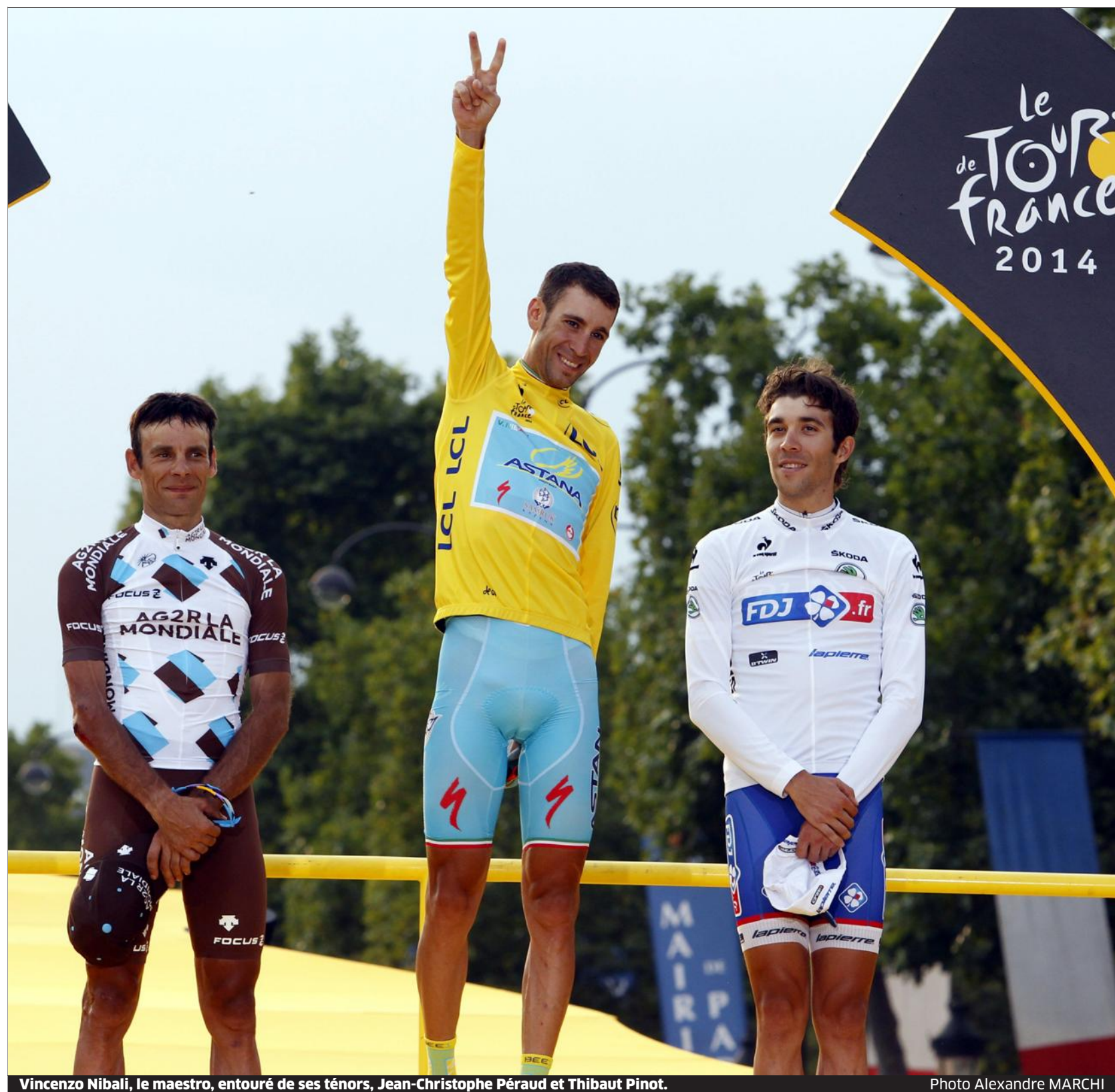
Vincenzo Nibali, le maestro, entouré de ses ténors, Jean-Christophe Péraud et Thibaut Pinot.