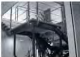
Accès de bureaux

www.metallerie-stael.com 93, rue Anatole France 59170 CROIX