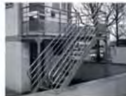
Accès extérieur poste de garde