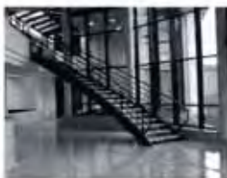
Equipement hall d'accueil