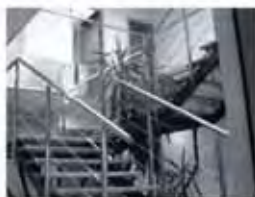
Escalier en inox brossé

Tél. 03 20 24 59 40 Fax : 03 20 27 61 26 contact@metallerie-stael.com