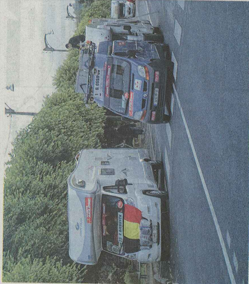
Invasion européenne sur Château-Thierry, entre les camping-car du belge Biebuyck et du russe Ossipov.