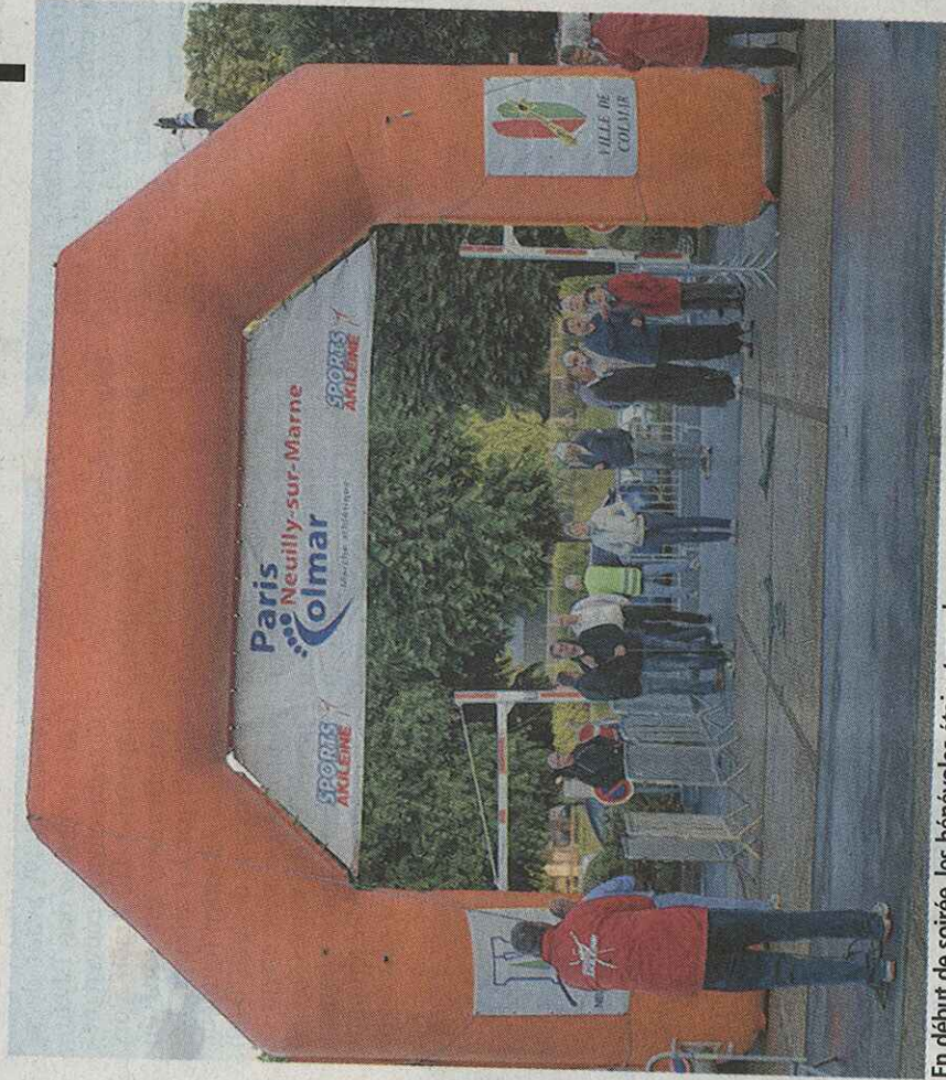
En début de soirée, les bénévoles étaient nombreux pour que tout se passe parfaitement.

Le Russe entre déjà dans la légende du Paris-Colmar. Avec quatre succès en cinq ans, il entre dans le cercle très fermé des très grands marcheurs de fond. Cette année, ce fut certes un peu plus dur que d'habitude, puisqu'il fut poussé dans ses ultimes retranchements par le vosgien Emmanuel Lassalle, qui pour sa deuxième participation, échoua à seulement 11 minutes du futur vainqueur. Il boucle les 426 kilomètres en 52h45. Ils sont 14 sur les 22 participants à rallier l'arrivée.